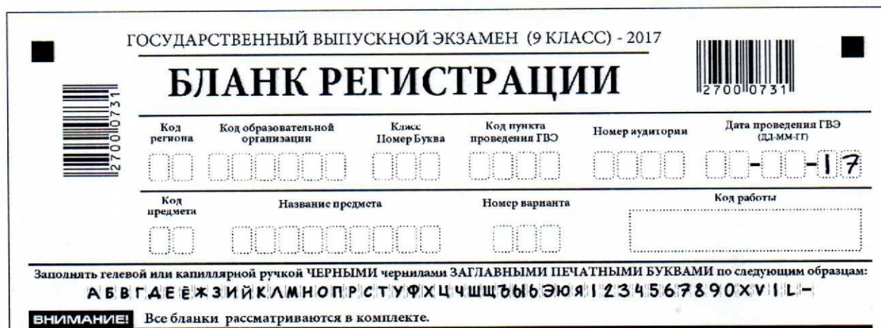
Таблица 1. Поля бланка регистрации участника ГВЭ, расположенные в верхней части бланка