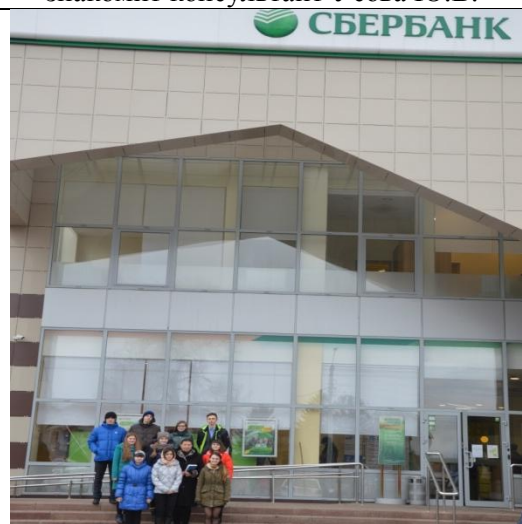
Экскурсия в Сбербанк России