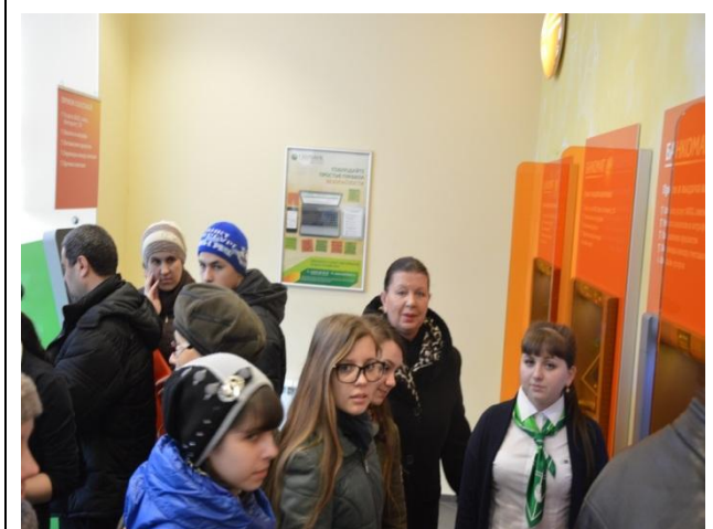
Карты оплаты Сбербанка: удобно, быстро, комфортно