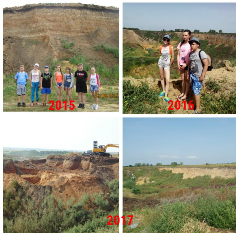
Рис. 1. Экспедиция по исследованию состояния отработанных карьеров

Поэтому целью проектно-исследовательской работы по изучению антропогенного рельефа является исследование состояния отработанных карьеров. В 2018 году, кроме того, создан проект по рекультивации одного из них. Предложены меры по восстановлению всех земель карьеров.