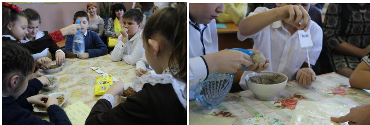
Рис. 2. Фрагмент интегрированного занятия по определению пород и их свойств

В целом, стоит отметить, что экспедиции - неотъемлемая часть исследований в области географии и химии, так как без сбора полевых данных не обойдётся ни один естествоиспытатель, в том числе и школьник. Именно экспедиционный метод обладает полифункциональностью, так как формирует ценностно-смысловые, учебно-познавательные, общекультурные, коммуникативные и информационные компетенции школьников.