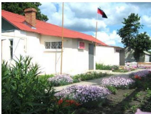
Учебно-тематическая экскурсия по территории Введено-Готнянского сельского поселения