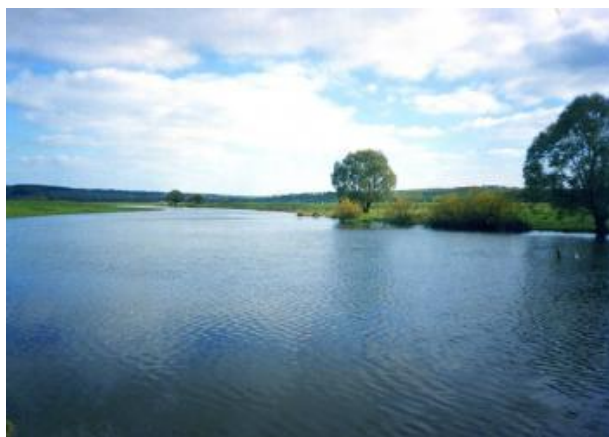
Учебно-тематическая экскурсия по территории Нижнепенского сельского поселения

Мемориал в честь 474 односельчан, погибших в годы Великой Отечественной войны. Установлен в с. Вышние Пены в 1969 г.