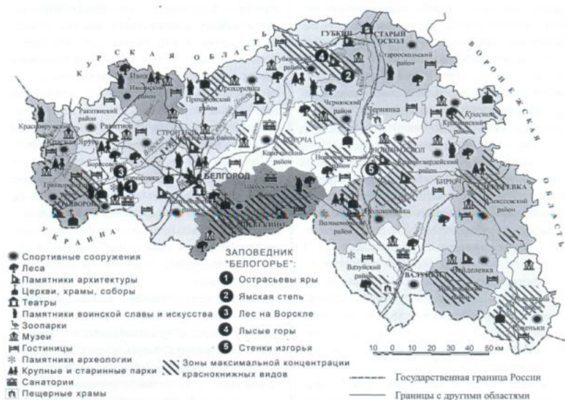
Туристско-рекреационные ресурсы Белгородской области

Развитие сельского туризма в Белгородской области началось в Грайворонском районе. Для того чтобы выявить весь туристический потенциал Грайворонщины, районная администрация организовала Центр туризма, народных традиций и промыслов. Была проведена полная «ревизия» всего, что можно предложить гостям в качестве туристических объектов. Власти «взяли на карандаш» каждый заповедный уголок, каждого мастера-умельца, каждого пчеловода и рукодельницу. «Вспомнить. Сохранить. Приумножить» – таков официальный девиз грайворонской инициативы.